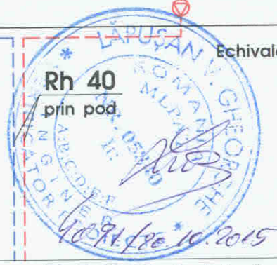
Echivalență diametre PP-R